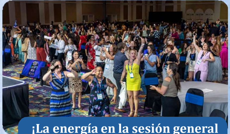
¡La energía en la sesión general del día 2 fue increíble!