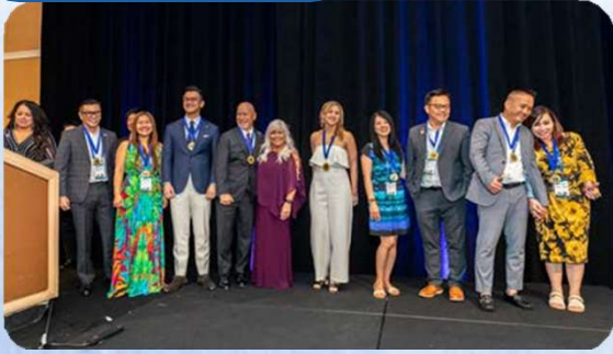
Ceremonia de reconocimiento a cena VIP