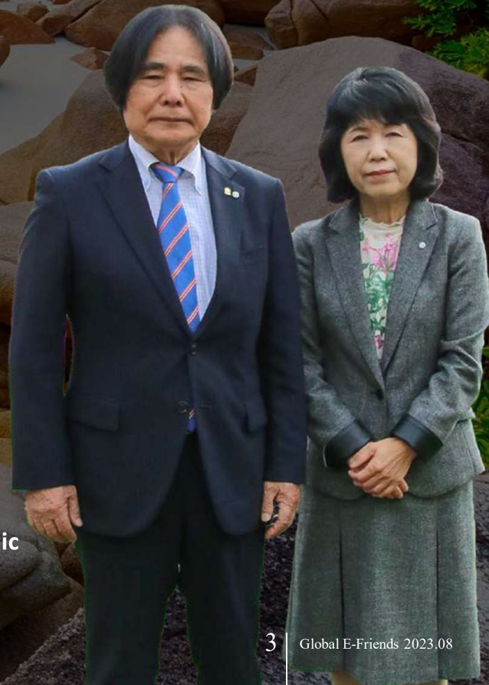
Hironari Ohshiro Fundador y CEO de Enagic

Comienza con una persona y repite un mensaje solidario, día tras día, y en poco tiempo tu círculo de agradecimiento crecerá y prosperará. Ayudemos a tantas personas como podamos en el mundo y transmitamos nuestro mensaje de Salud Verdadera. Ahora es el momento de actuar y por supuesto de beber Agua Kangen®. De hecho, voy a tomar una refrescante e hidratante botella de Agua Kangen® ahora mismo.