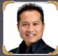
6A5-3 Siha Top