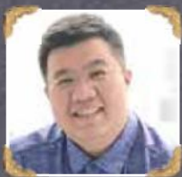
6A3-3 Low Yean Yean