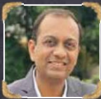
6A3-3 Isha Enterprise