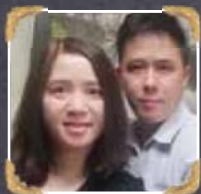
6A2-3 Pong & Flora