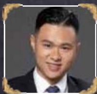
6A2-3 Lemon Chon