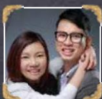
6A2-3 Pak & Lok