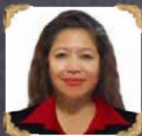
6A2-3 Rosavilla Verdera