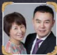
6A2-3 Ge Yuan Cai