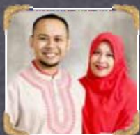
6A2-3 Taufiq Hidayat