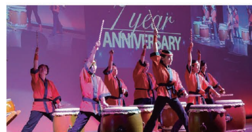
A powerful performance was given by the local Japanese drum team. 場内に響き渡った現地和太鼓チームの力強い演奏