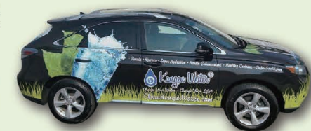
A daring Kangen Car design. 斬新なデザインのKangen車(カー)