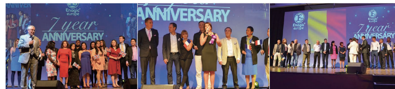
(From left) Distributors from England, France, Romania, were introduced on stage. 壇上で紹介される(左から)イギリス、フランス、ルーマニアの販売店