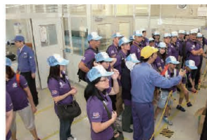
Everyone attentively observes the assembly of parts. 組み立て部門を熱心に見学