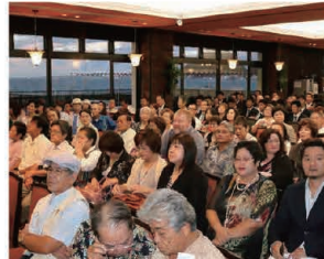
Around 200 people rushed to the launch party. 約200名が詰めかけた出版記念会