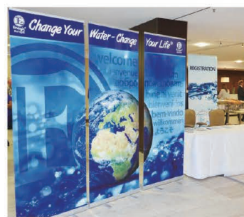
The impressive banner near the reception area 受付付近に設えた印象的なバナー