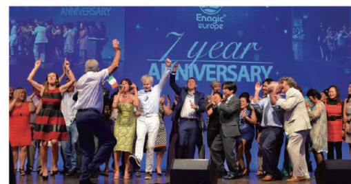
The big chorus of our Ireland distributors heightened the excitement. 大合唱で会場を盛り上げるアイルランドの販売店