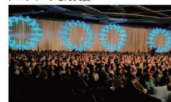
The venue overflowed with 2,000 participants. 2,000人で埋め尽くされた会場