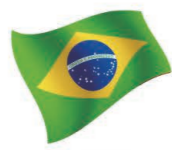
Tomiyo Ishiyama トミヨ・イシヤマ