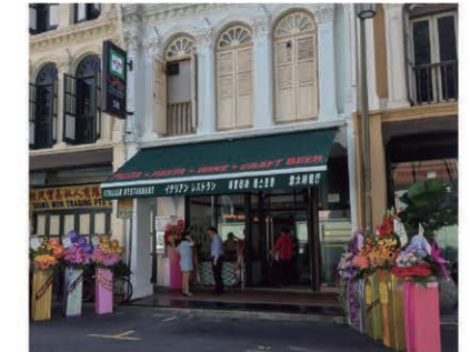
The grand opening of the restaurant (July 1st) 7月1日の開店記念日のレストラン

Address: 38 Mosque Street, Singapore Phone: +65 6220 0093