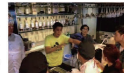
The restaurant owner explains about Kangen Water. 水の説明をおこなう店のマネージャー