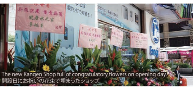
The new Kangen Shop full of congratulatory flowers on opening day. 開設日にお祝いの花束で埋まったショップ。

8月3日、有力販売店のキャシーさんが香港の繁華街に還元ショップをオープンしました。開設当日には多くの仲間たちが集まり盛大に祝いました。「水世界」と名付けられたショップはビル1階にあり、内部も明るく広々としていて販売店活動の拠点にふさわしい造りです。キャシーさんは「念願のショップをようやく開設できました。これを機にいつそ販売店活動に力を入れていきます」と決意を語っていました。