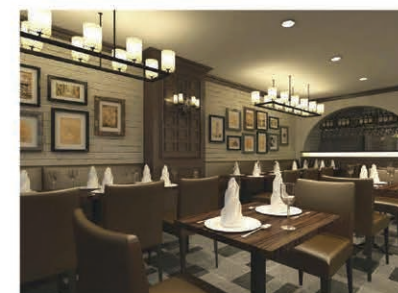
Relaxing and chic atmosphere of the restaurant. シックで落ち着いた雰囲気の内

店名を英語、中国語だけでなく、日本語やハングルでも表記して外国人客が来店しやすい工夫をしているが、何とんでもヴィタ・イタリアーナは、レベラックを活用することで安心安全な店としてお勧めである。