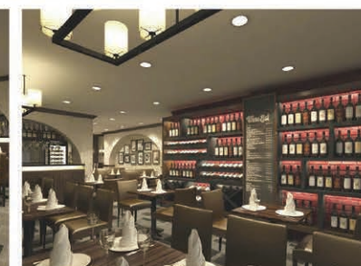
Wine bottles line the wall of the restaurant. ワインも多数用意