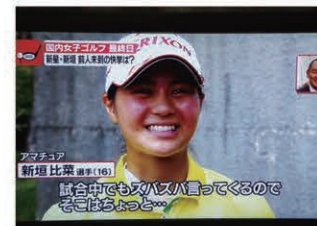
Golfer Arakaki featured on TV in a sports news segment. TVスポーツニュースで取り上げられた新垣選手