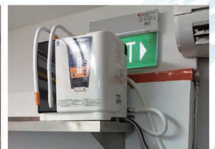
LeveLuk SUPER 501 installed in the kitchen area. 調理場に設置されたスーパー501