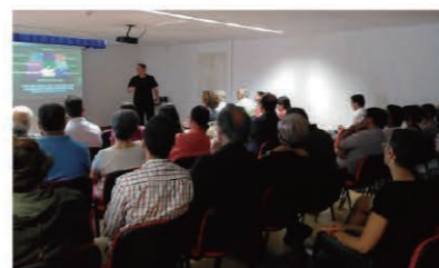
Many participants filled up the venue. センターに詰めかけた参加者