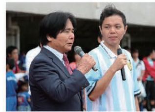
Passionate opening speech by the CEO (interpreter on the right). 力強く開会宣言をする大城会長 (右は中国語通訳)

19、20日で予選リーグと決勝トーナメントをおこなう日程で、沖縄県から37チーム、海外からは台湾7チーム、香港1チームが参加しました。試合はU-12(12歳以下)、U-10、U-8の3カテゴリーに別れ、いずれも8人制で実施。台風接近による大雨にも関わらず、子どもたちはピッチで元気いっぱいプレーしました。結果は3カテゴリーともみごと沖縄県のチームが優勝をはたしました。