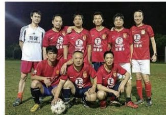
Members of the Zhongshan distributors' team. 中山市の販売店チームの皆さん

フォームを着用し、試合に臨んでいますが、さてその「腕前」はいかが？ 世界で最も普及しているスポーツはサッカーですから、いずれ各国にエナジック販売店チームが結成され、世界大会を開催する、なんてこともあながい夢ではないかも。