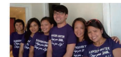
Distributors who organized the Milan seminar. ミラノセミナーを主催した販売店