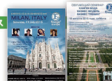
Posters announcing seminars in Italy and Moscow. 各地のセミナーの開催情報を伝えるポスター

7月18日にはオランダの「海辺の王室の都市」として知られるデン・ハーグで開催され大盛況でした。そして8月15日にはモスクワでも開催。支店開設とともに、ロシアでも本格的な販売店活動が始まっています。