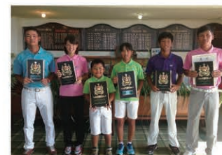
Our golfers achieved great results at the "Okinawa Junior Golf Championship". 「沖縄県ジュニアゴルフ」で好成績を収めた選手たち

彼女はすでに「日本女子オープン」(10月)というメジャー大会の出場権も獲得しています。