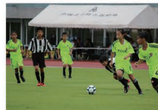
Players sprinted for the ball in the rain. 雨中のピッチを駆け巡る選手たち