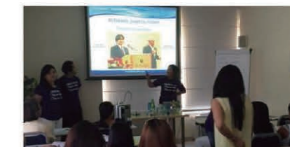
The Milan seminar was a big success. 盛況だったミラノ会場