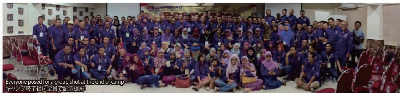
Everyone posed for a group shot at the end of camp. キャンプ終了後に全員で記念撮影