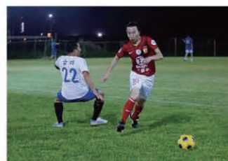
Distributors demonstrated some impressive footwork. 華麗な足技を見せる販売店メンバー