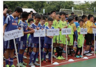
Full of nervous excitement, the players line-up for the opening ceremony. 開会式でちょっと緊張気味の選手たち